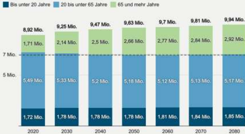
Bevölkerungsentwicklung bis 2080